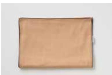
ガーゼフェイスタオル 5重合わせ 柿渋