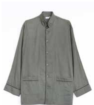
ガーゼバジャマ 2重合わせ すみくろ／上下セット SS・S・M・L・LL