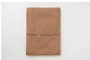
ガーゼ掛布団カバー 2重合わせ 柿渋 S・SD・D・Q・K