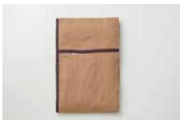
ガーゼケット 5重合わせ 柿渋 S