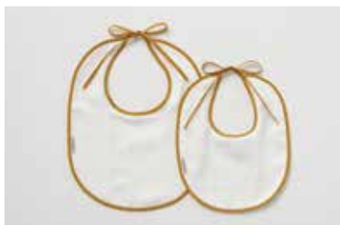
ベビーガーゼビブ(前掛け) 5重合わせ 大・小 マスタード・グレー