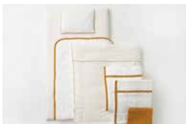
ベビーふとん 10点セット マスタード・グレー