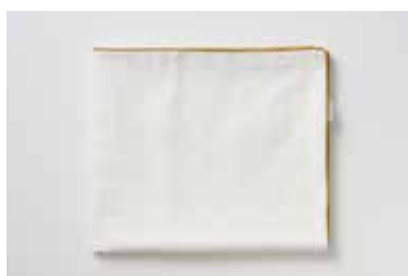
ベビーガーゼ湯上げタオル 3重合わせ マスタード・グレー