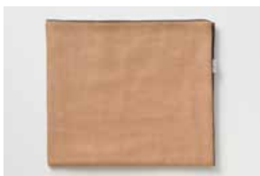
ガーゼバスタオル 5重合わせ 柿渋