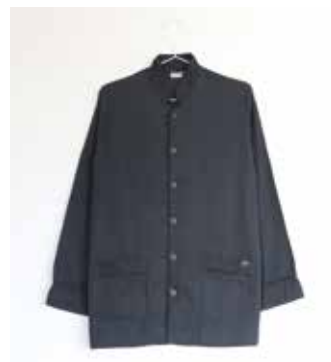
ガーゼバジャマ 2重合わせ チャコールグレー S・M・L・LL