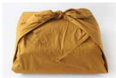
ベビーふとん 10点セットは、大判風呂敷で全て まとめて包むことができます。