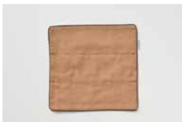
ガーゼハンドタオル 5重合わせ 柿渋