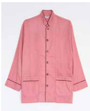
ガーゼバジャマ 2重合わせ さんご／上下セット SS・S・M・L・LL