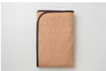
ガーゼ敷きパッド(脱脂綿入り) 4層 柿渋 S・SD・D