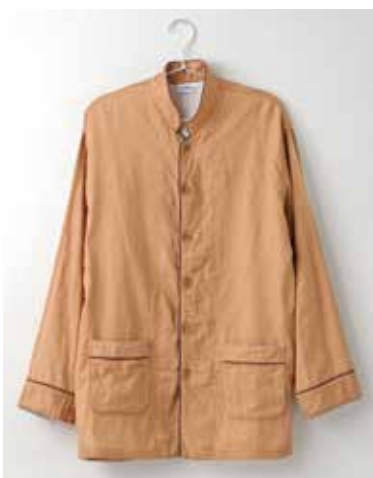
ガーゼパジャマ 2重合わせ／3重合わせ 柿渋／上下セット SS・S・M・L・LL