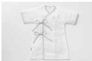
ベビーガーゼローブ 3重合わせ マスタード・グレー