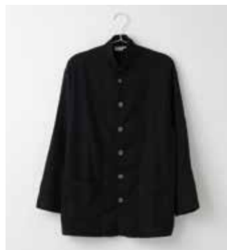
ガーゼパジャマ 2重合わせ 黒 SS・S・M・L・LL