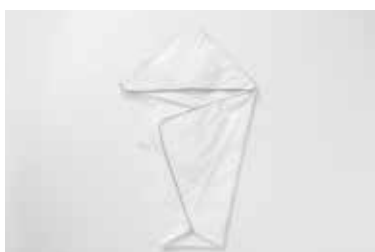
ベビーガーゼアフガン 5重合わせ マスタード・グレー