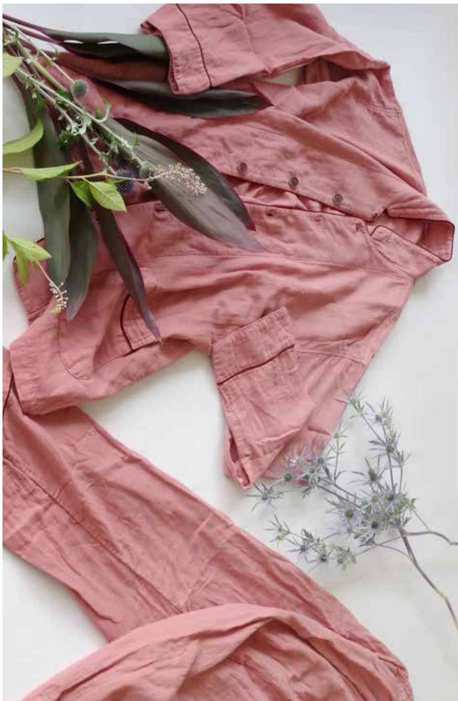
Herbal-Dyed SANGO さんご