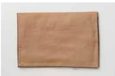
ガーゼ枕カバー 3重合わせ 柿渋 M・L