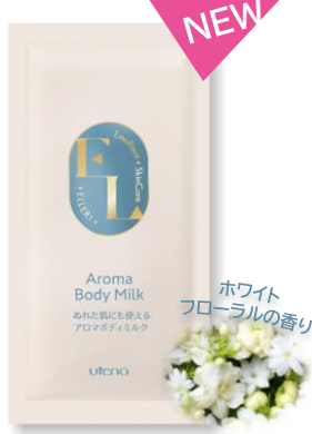
ぬれた肌にも使える アロマボディミルク

コクのある美容液を たっぷり含み、心地よく お肌を包みこむシートマスク。 マスクがピタッと密着する ことで、美容液が角質層の すみずみまで浸透し、 ふっくらとしたハリと うるおいをあたえます。