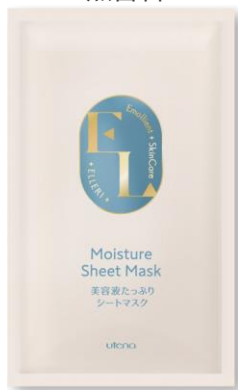
美容液たっぷり シートマスク

<保湿成分> ヒアルロン酸GL*1 ローヤルゼリーGL*2配合 無香料 <保湿成分> コラーゲンGL*3 ヒアルロン酸GL*1配合