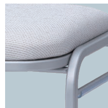
フレーム：シルバー色 (N)