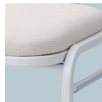
フレーム：ホワイト色 (W)