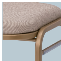
フレーム：ゴールド色 (K)