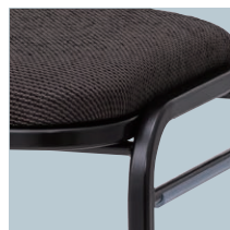
フレーム：ブラック色 (B)