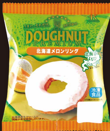
プレミアム 北海道メロンリング