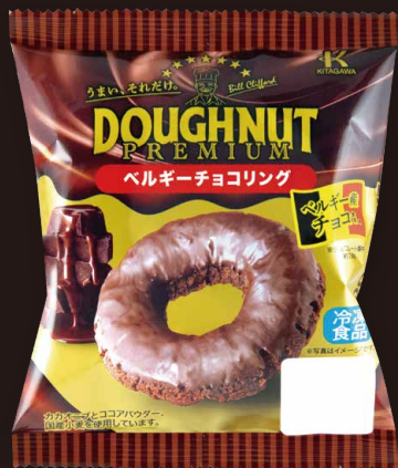
プレミアム ベルギー チョコリング