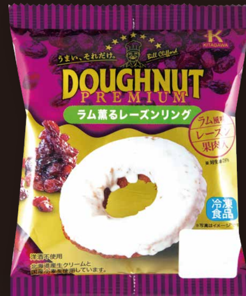
プレミアム ラム薫る レーズンリング