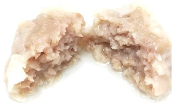
商品化例 * インスタパック