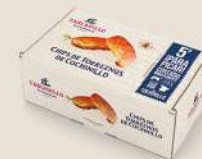
Chips de Torreznos