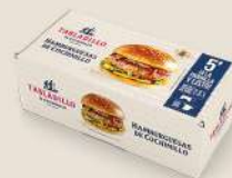
Hamburguesas M y S