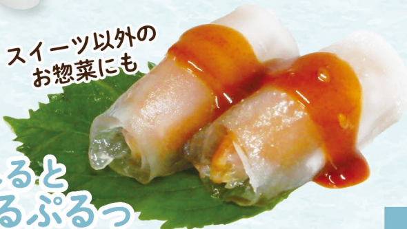
ソトクソトク コチュジャンソースがけ