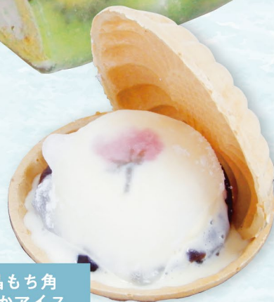
水晶もち角 もなかアイス