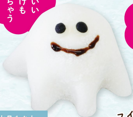
水晶もち丸 おばけ大福