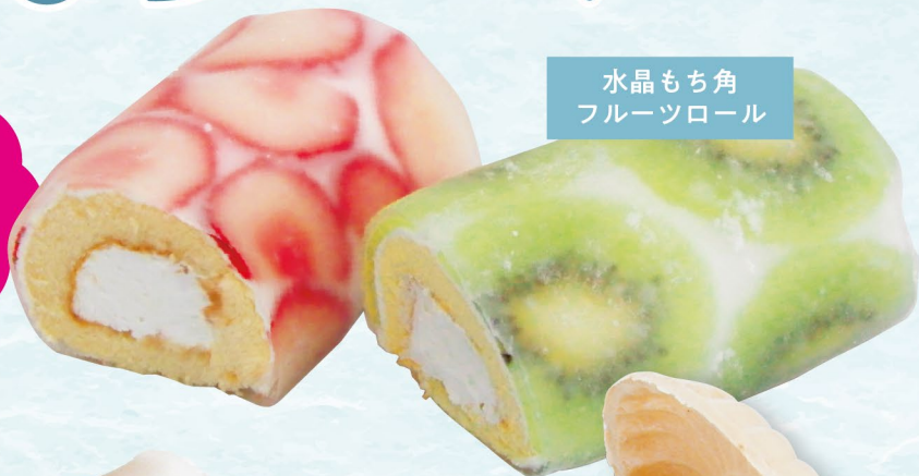
水晶もち角 フルーツロール