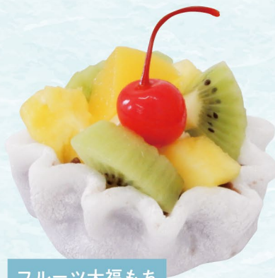
フルーツ大福もち