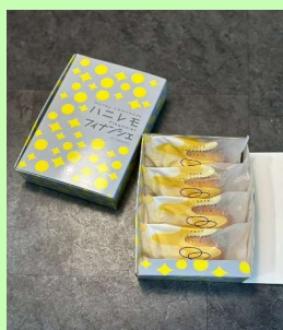
写真 商品の全体がわかる写真を貼付